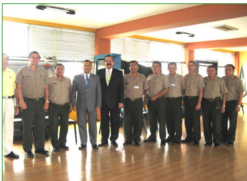
El General De División Don Carlos Alfonso Tafur Ganoza con personal del Instituto Geográfico Nacional