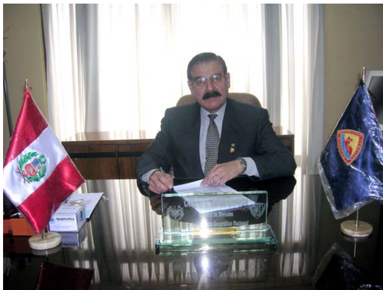
GRAL. DIV. CARLOS ALFONSO TAFUR GANOZA PRESIDENTE DE LA SECCIÓN NACIONAL IPGH-PERÚ

El objetivo principal de la Sección Nacional IPGH - PERU, está basado en el desarrollo de actividades, proyectos y publicaciones que promuevan y difundan la investigación científica que se desarrolla en nuestro país; así como dar a conocer a los Estados miembros del IPGH, el desarrollo de dichas actividades.