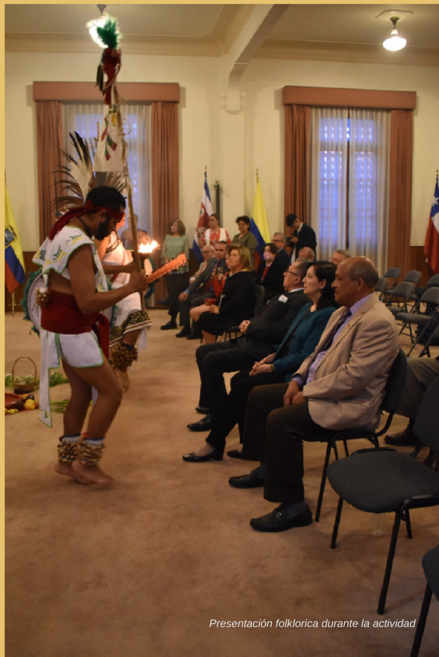
Presentación folklórica durante la actividad