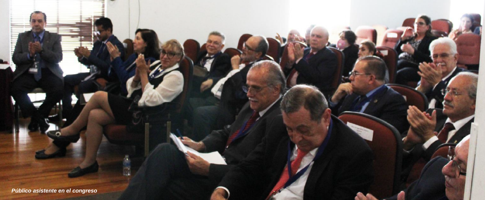
Público asistente en el congreso