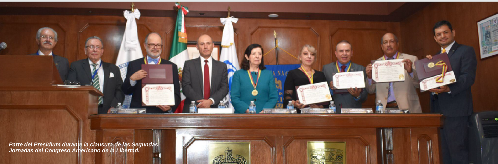
Parte del Presidium durante la clausura de las Segundas Jornadas del Congreso Americano de la Libertad.

Los asistentes al encuentro académico participaron en la tarde del jueves 25 de mayo en un recorrido por el Castillo de Chapultepec, cuya construcción inició en 1785 y donde está el Museo Nacional de Historia.