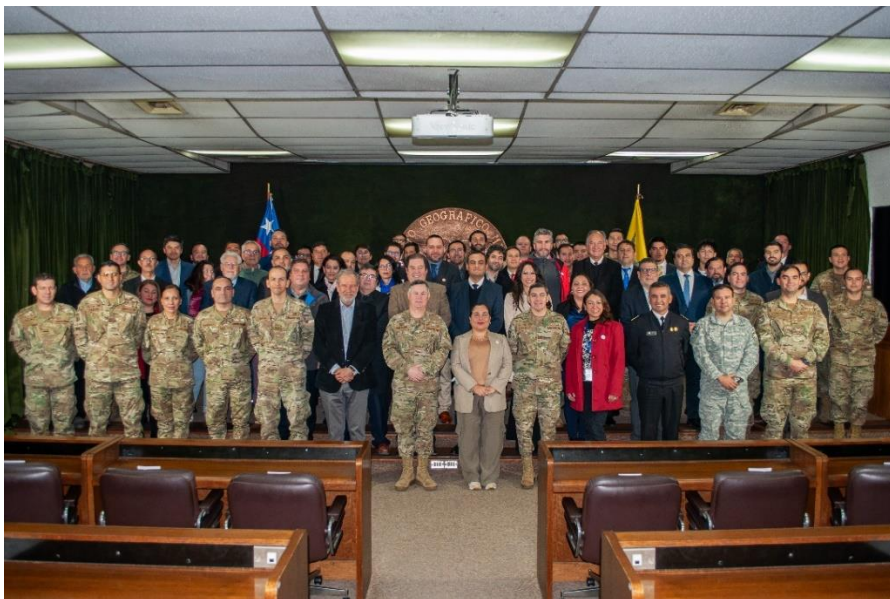
Fotografía Lanzamiento de la Nueva Red Geodésica Nacional SIRGAS-CHILE, Época 2025.