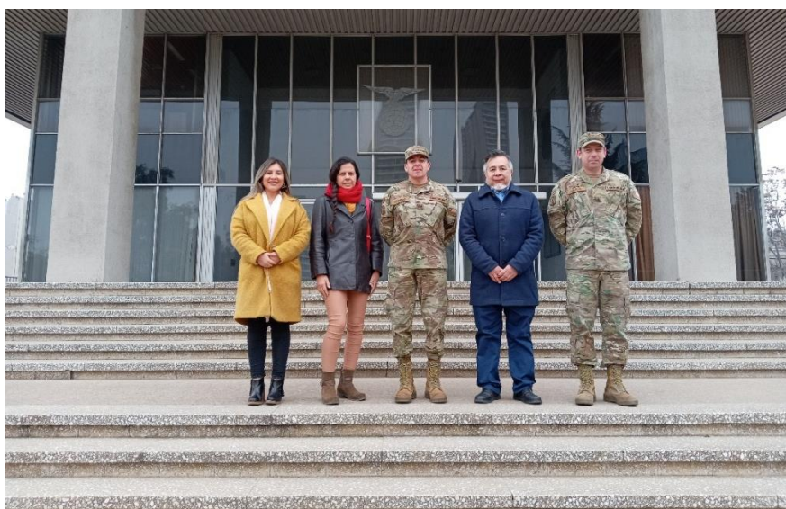
Fotografía visita directivos SOCHIGEO.

El objetivo de esta actividad fue coordinar iniciativas y trabajos conjuntos en el ámbito de la Geografía y la Educación, alineándose ambas instituciones con los fines compartidos para el desarrollo y la contribución al país.