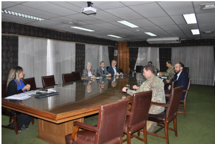
Reunión anual de directivos de la Sección Nacional del IPGH, año 2025.

En la reunión se destacó la exitosa realización de la 25ª Asamblea General del IPGH en Chile en 2024 y se abordaron temas clave para la próxima asamblea del año 2025, así como las gestiones realizadas por la Sección Nacional desde la última reunión de esta categoría sostenida. Asimismo, se destacó la nueva propuesta y elección para el cargo de Miembro Principal Nacional para la Comisión de Geofísica del IPGH, vacante para ese entonces.