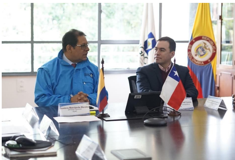
Reunión de trabajo del proyecto de cooperación bilateral desarrollado entre Chile y Colombia.

El encuentro virtual buscó dar a conocer los avances y resultados alcanzados del proyecto denominado “Optimización de procesos y herramientas metodológicas para la generación de datos y productos geodésicos y cartográficos en los institutos geográficos de Colombia y Chile”, así como también fomentar un espacio de diálogo y cooperación entre profesionales del ámbito de las geociencias de ambos países.