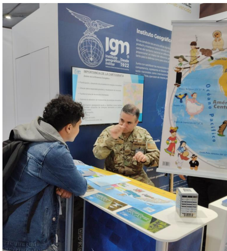
Stand IGM, EXPONAVAL 2025.

En esta ocasión, el IGM presentó al público asistente los avances más recientes en sus áreas de trabajo, destacando especialmente la cartografía a escala 1:25.000 y el proyecto “Sistema de Referencia Geodésico para las Américas (SIRGAS)”, ambos pilares clave en el ámbito de la geoinformación y la cooperación internacional.