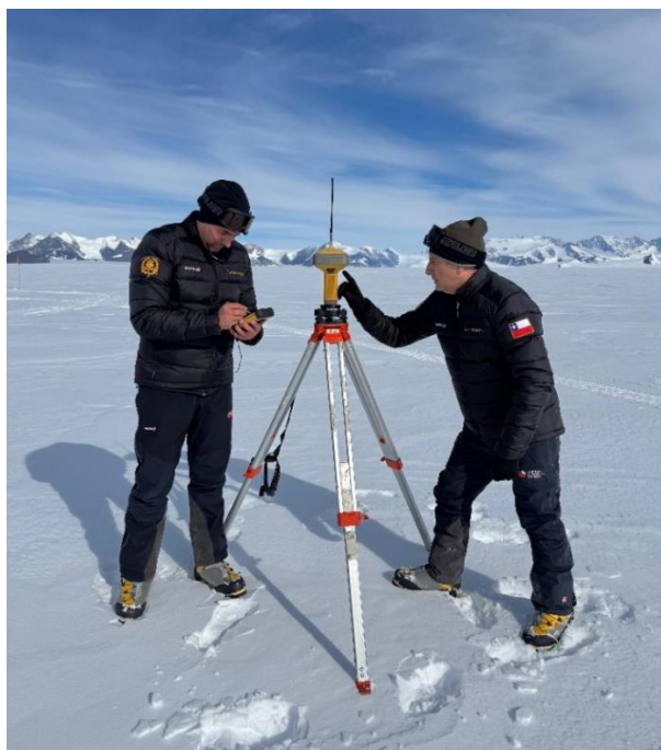
Personal IGM trabajando en la Antártica.