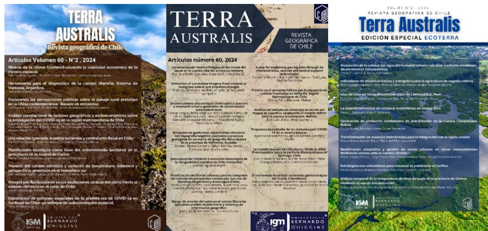
Portadas últimos volúmenes publicados de la Revista Terra Australis.

La revista Terra Australis es una publicación indexada, de acceso abierto y que mantiene abierta la convocatoria de recepción de artículos que se ajusten a su línea editorial durante todo el año.