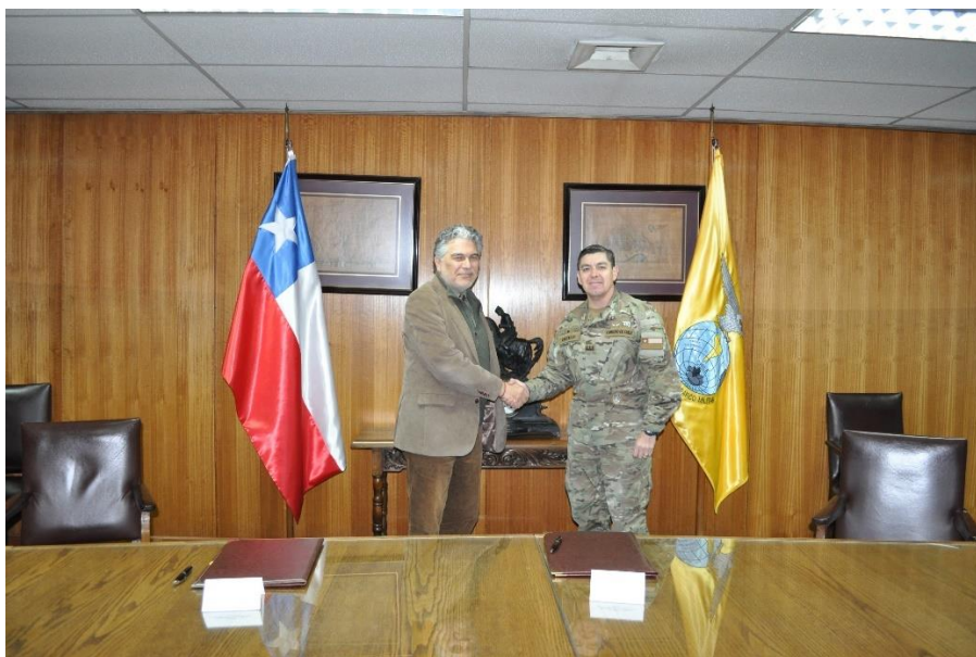
Firma de convenio IGM – Academia Chilena de la Lengua.