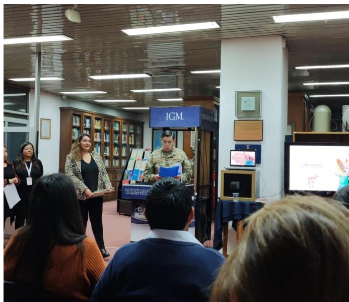
Inauguración Tertulias Geográficas IGM 2025.

Las tertulias están orientadas a promover los conocimientos en ciencias de la Tierra, combinando enfoques geográficos, literarios y culturales; buscando fomentar el aprendizaje y la reflexión a través del intercambio de ideas y experiencias entre los expositores y público asistente.