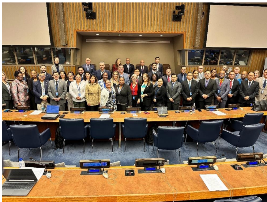
Fotografía delegados asistentes a la Decimoquinta Sesión UN-GGIM.