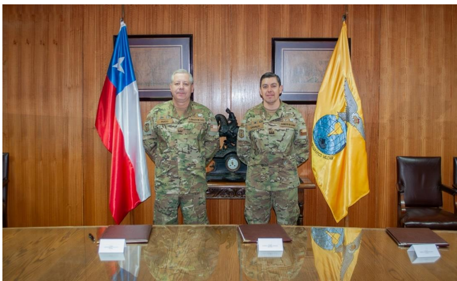
Firma de actas de entrega del IGM.