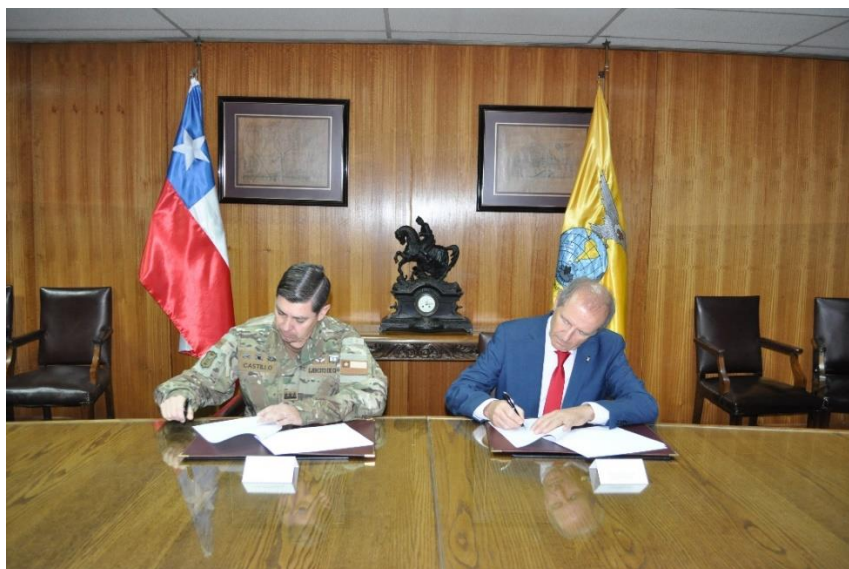
Firma de convenio IGM – INACH.