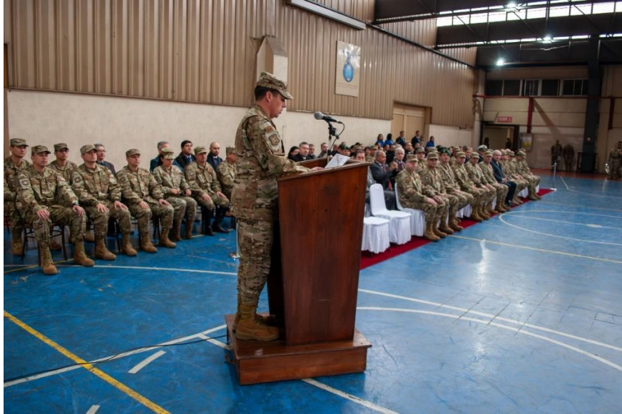
Ceremonia de conmemoración del centésimo tercer aniversario del IGM.

Finalmente, se reconoció el esfuerzo y dedicación de los funcionarios y profesionales del IGM mediante la entrega de reconocimientos a los mismos.