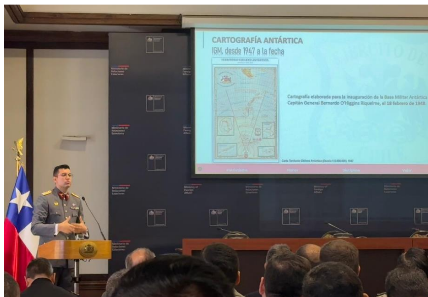
Expositor IGM en dependencias del MINREL.

Asimismo, se destacó la cooperación entre organismos estatales y actores internacionales, resaltando el aporte del IGM en los desafíos científico-técnicos actuales en dicho territorio.