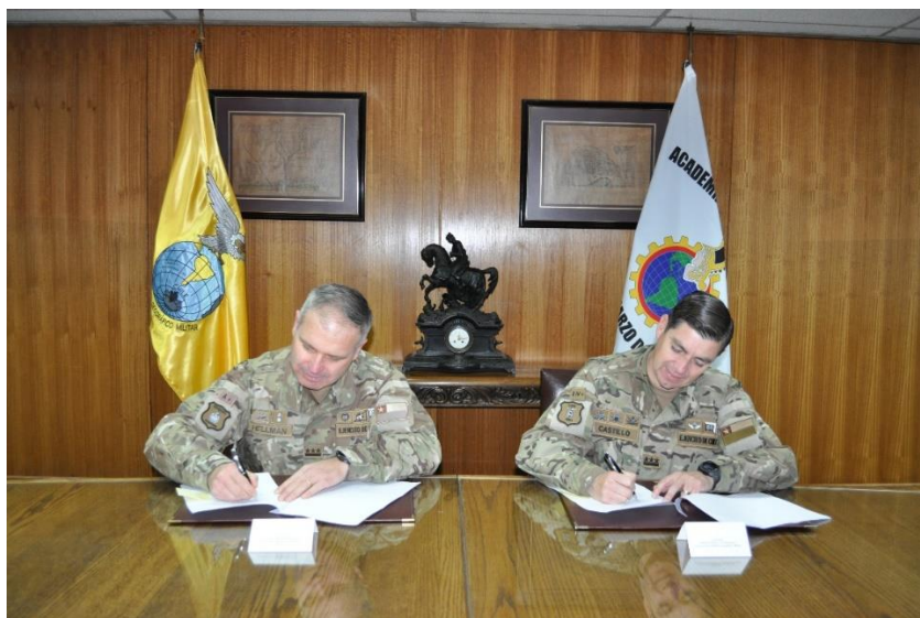
Firma de convenio IGM – ACAPOMIL.