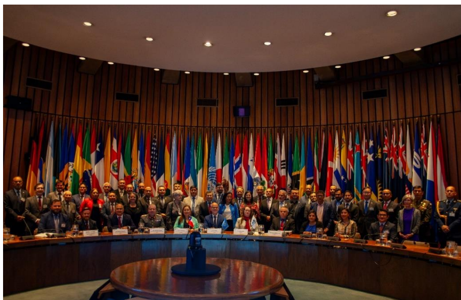
Apertura de la 25ª Asamblea General del IPGH, año 2025.

En esta ocasión, la Asamblea General como el “ órgano supremo que establece las directrices científicas, administrativas y financieras ” del IPGH, abordó una serie de temas estratégicos. Las discusiones y acuerdos estuvieron orientados a fortalecer la integración y el desarrollo de las geociencias y la historia en la región, siempre bajo el marco de la colaboración y el apoyo internacional; logrando aprobar bajo dichos parámetros 13 resoluciones.