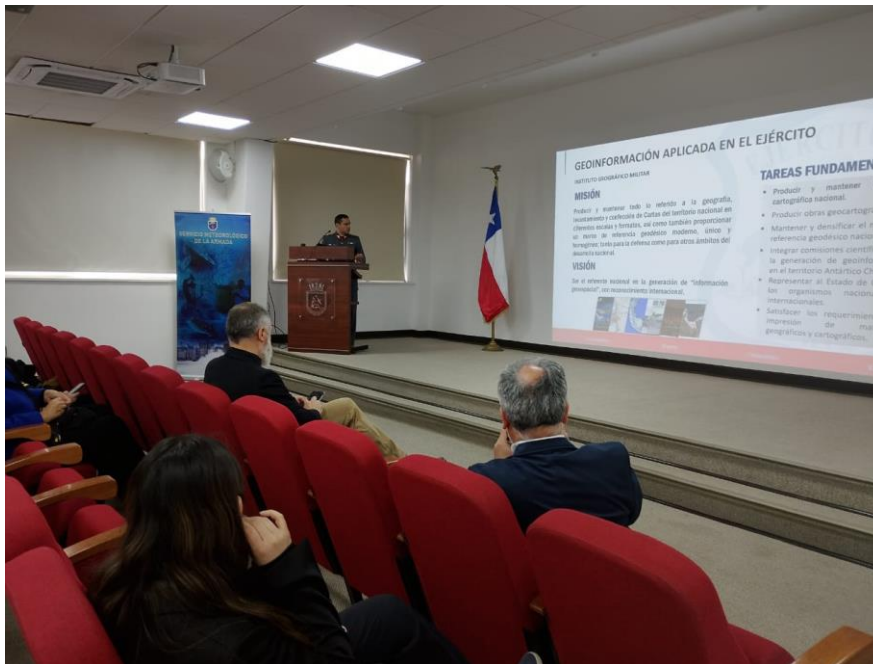
Expositor IGM en el VII Foro Nacional de Percepción Remota y SIG.

estuvo dirigida a científicos, así como a profesionales del sector público y privado e interesados en el campo de la geoinformación.