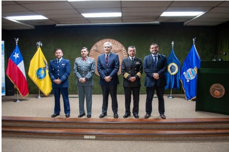
Representantes de los organismos que integran el CAMGU.