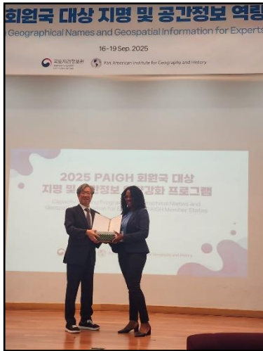
Participante recibiendo certificado