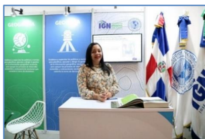
Stand en la feria