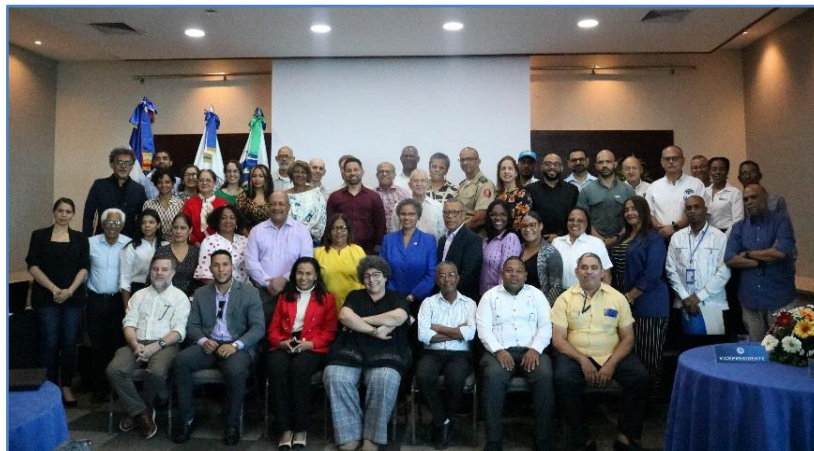
Miembros de la Sección Nacional

En la sexta sesión fue tomada la foto grupal de los miembros presentes que conforman las comisiones acompañados de la directiva de la sección nacional.