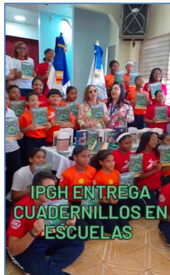
Entrega de cuadernillos y publicaciones de la Sección Nacional