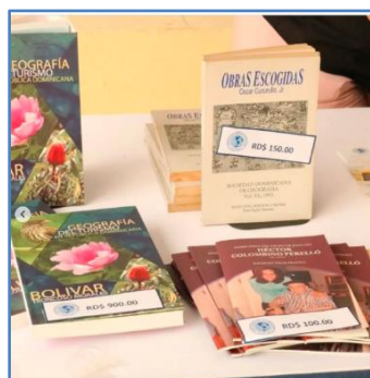
Libros en venta