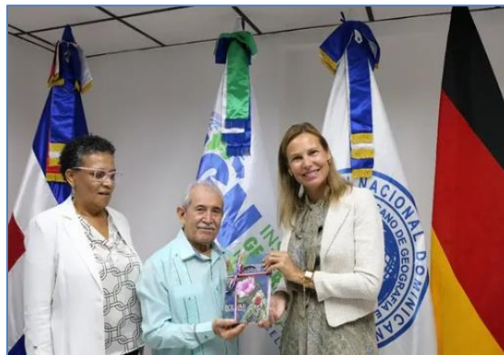
Entrega de las publicaciones de la Sección Nacional

El 30 de julio de 2025, su Excelencia la señora Maike Friedrichsen, Embajadora Extraordinaria y Plenipotenciaria de la República Federal de Alemania en la República Dominicana, realizó una visita a nuestras instalaciones. En el marco de este encuentro, recibió de manos del señor Bolívar Troncoso las más recientes publicaciones de la Sección Nacional.