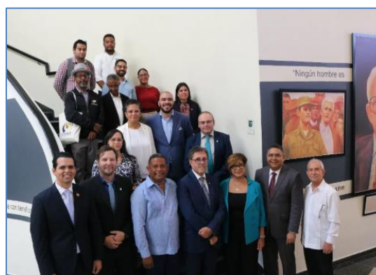
Delegación Chilena y miembros de la Sección Nacional