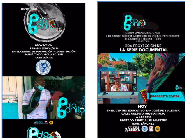
Promoción de las proyecciones