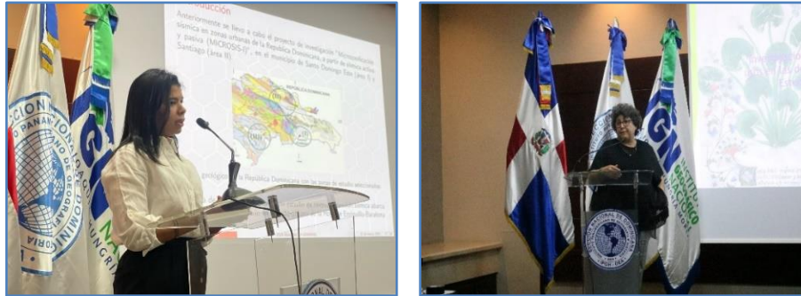
Responsables de los proyectos GEOF-03 y HIST-03