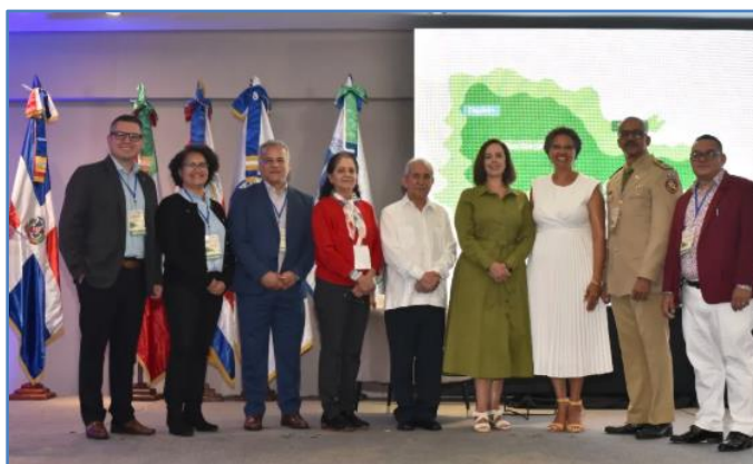
Expositores del congreso