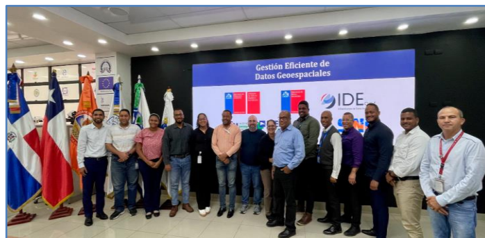
Participantes del evento

La actividad tuvo lugar en las oficinas del Sistema Integrado Nacional de Información (SINI) y reunió a representantes de instituciones clave del sector público dominicano.