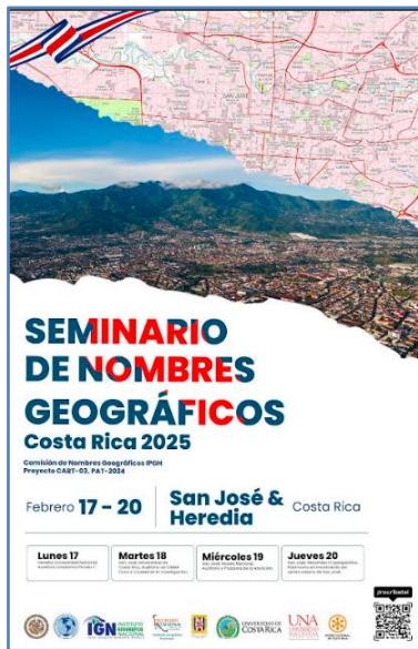
Afiche del seminario

El evento fue realizado en las instalaciones de la Universidad Nacional en Costa Rica, el Museo Nacional e Instituto Geográfico Nacional del Registro Nacional.