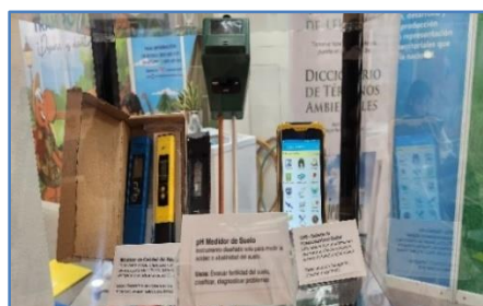
Vitrina en el Stand