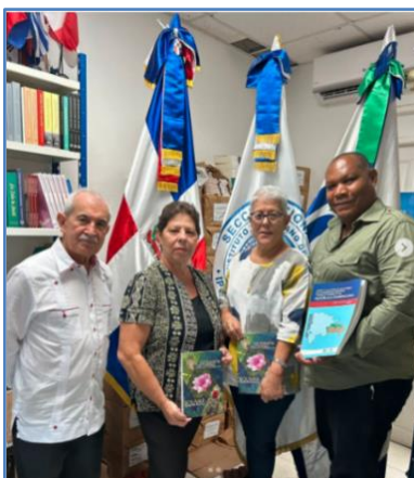
Entrega de publicaciones de la Sección Nacional