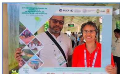
Representantes de la Sección Nacional