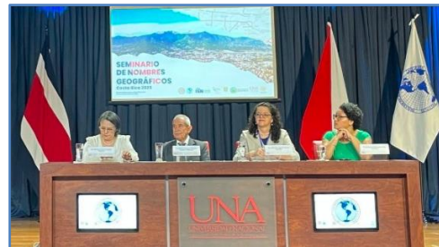
Mesa de honor del seminario