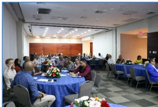
Reuniones individuales de cada comisión

Cada comisión en la tercera sesión se reunió de manera independiente a tratar temas de interés, y a socializar las propuestas de proyectos al Programa de Asistencia Técnica (PAT- 2025) que pudieran presentarse antes del 5 de mayo del año que discurre.