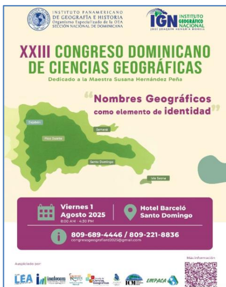
Afiche del congreso

Asimismo, se contó con la presencia de docentes de distintas universidades: Universidad Nacional Pedro Henríquez Ureña (UNPHU), Instituto Tecnológico de Santo Domingo (INTEC), Universidad Católica Santo Domingo (UCSD) y la Universidad Autónoma de Santo Domingo (UASD), junto a sus dependencias, el Instituto Geográfico Universitario (IGU), el Centro de Sismología y la Escuela de Ciencias, además de representantes de colegios privados.