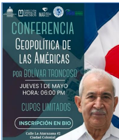
Afiche de promoción de la conferencia

Los temas claves como la influencia de las potencias globales en la región, los desafíos de la integración latinoamericana y el papel estratégico del Caribe en el contexto geopolítico actual.