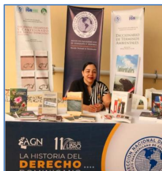
Stand de la feria

En esta ocasión, editoriales nacionales estuvieron presentes, exhibiendo sus publicaciones más recientes sobre historia dominicana. Contando con la presencia de destacados historiadores, escritores, académicos y autoridades gubernamentales, quienes presentarán novedades editoriales y participarán en mesas redondas y conferencias.