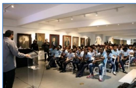
Participantes de la charla