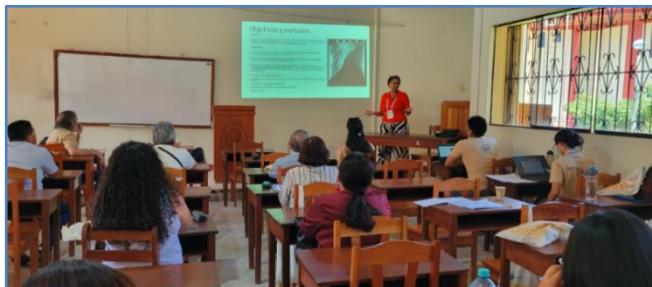
Miembro Nacional de la Comisión de Geografía exponiendo

El evento contó con la participación de expositores provenientes de distintas regiones del Perú, especialmente de aquellas que integran la Amazonía, así como de representantes de Colombia y la República Dominicana.