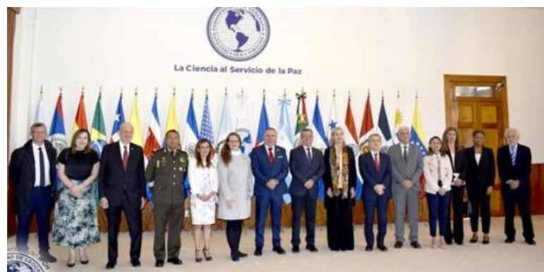
Instalaciones Sede del IPGH