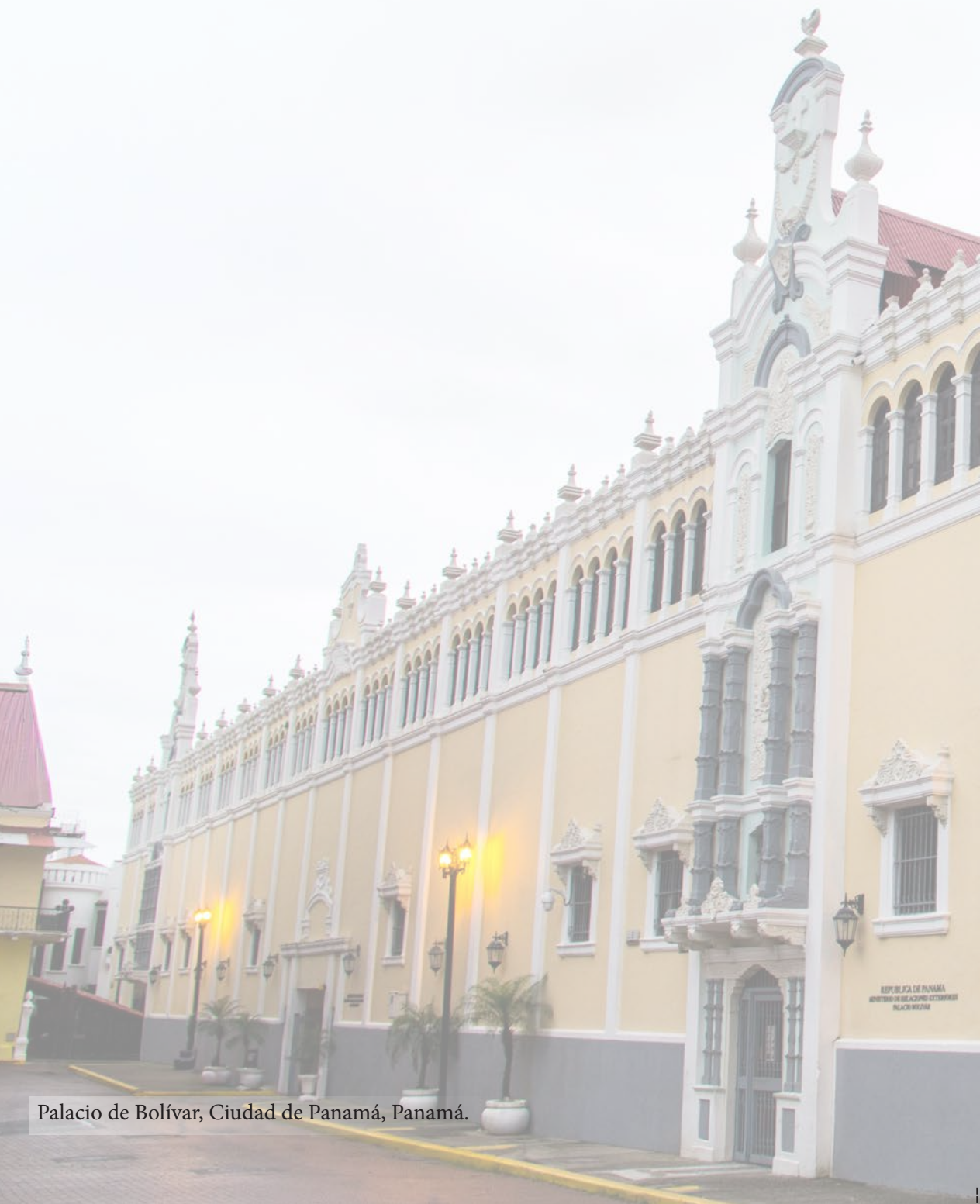
Palacio de Bolívar, Ciudad de Panamá, Panamá.