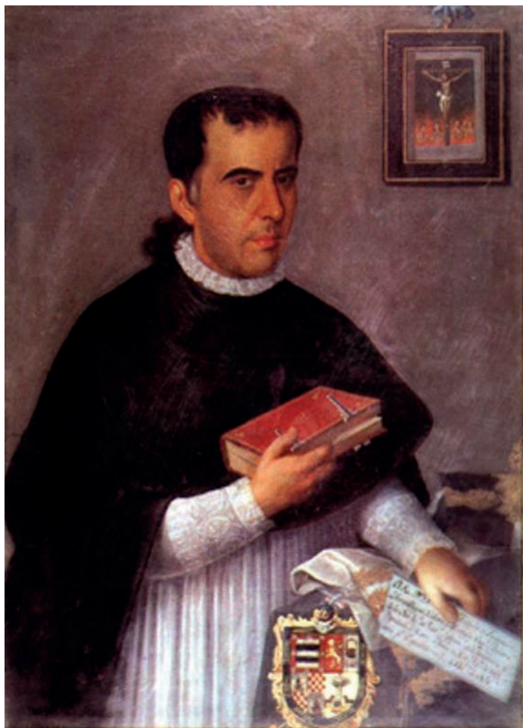
Presbítero Antonio Larrazábal y Arrivillaga, diplomático guatemalteco, pintura de Juan José Rosales (1811).

los diputados serían uno por cada capital cabeza de partido en estas diferentes provincias. Y fijaba el procedimiento interno de la elección: se haría por el ayuntamiento de cada capital, nombrándose tres naturales de la provincia de calidades especiales, sorteándose después uno de tres, y el que saliera a primera suerte sería el diputado en Cortes. 9