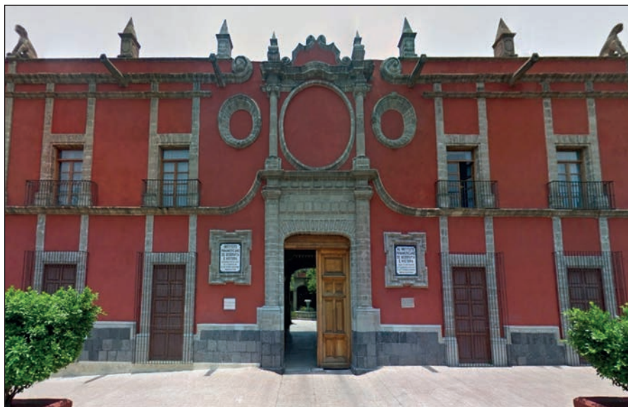
Entrada lateral del Palacio del Arzobispado, sede del Congreso Anfictiónico de Tacubaya de 1826, Ciudad de México, actualmente aloja al Instituto Panamericano de Geografía e Historia (IPGH).

En un principio, Guadalupe Victoria mantuvo un gabinete conservador con don Lucas Alamán al frente; pero poco a poco fue deslizándose hacia el federalismo de tendencias liberales; por otra parte, el gobierno era totalmente radical en contra de los españoles. Los radicales antiespañoles deseaban no solo la separación de los españoles de sus puestos, sino que los consideraban un obstáculo a la reforma social de México. Este sentimiento antiespañol se agravaba con las amenazas de España. No debemos olvidar que desde 1823 y por los dos años siguientes, la guarnición española de la isla de San Juan de Ulúa bombardeó el puerto de Veracruz, lo que causó daños graves a la población civil mexicana, esto se consideró como un estado de guerra permanente entre México y España. Finalmente, la guarnición española fue obligada a rendirse en 1825. 31