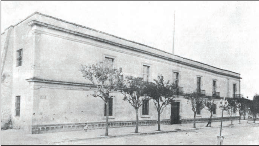
Fachada principal del Palacio del Arzobispado, sede del Congreso Anfictiónico de Tacubaya de 1826, Ciudad de México, actualmente aloja al Servicio Meteorológico Nacional (SMN), a la Comisión Nacional del Agua (CONAGUA) y al Instituto de Administración y Avalúos de Bienes Nacionales (INDAABIN).